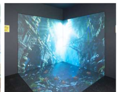
3面LEDでの設置例（左右壁・床）